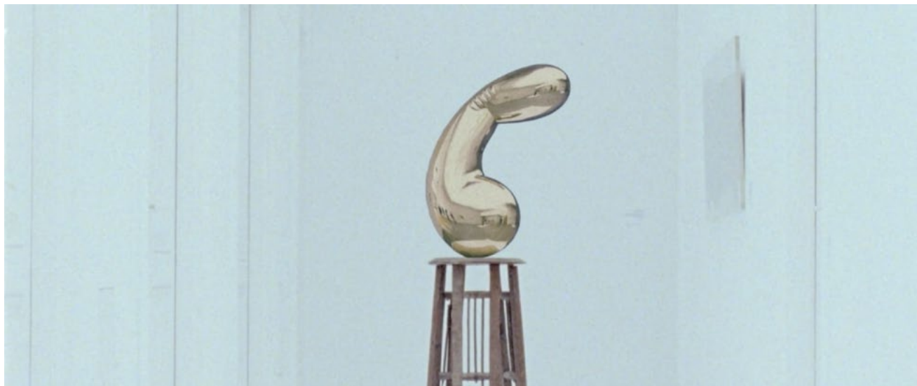
Gabriel Abrantes, A Brief History of Princess X , 2016

Séance Atelier Solidaire Séances Festival F'A'A Soirée d'ouverture & cocktail à la Galerie François I er 1 rue du Bourg Coustant 18700 Aubigny-sur-Nère