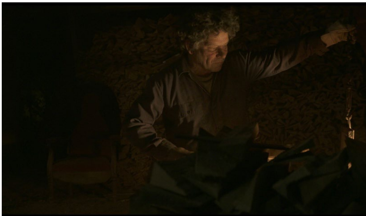
Jonathan Safran Foer, La main sauvage , 2024