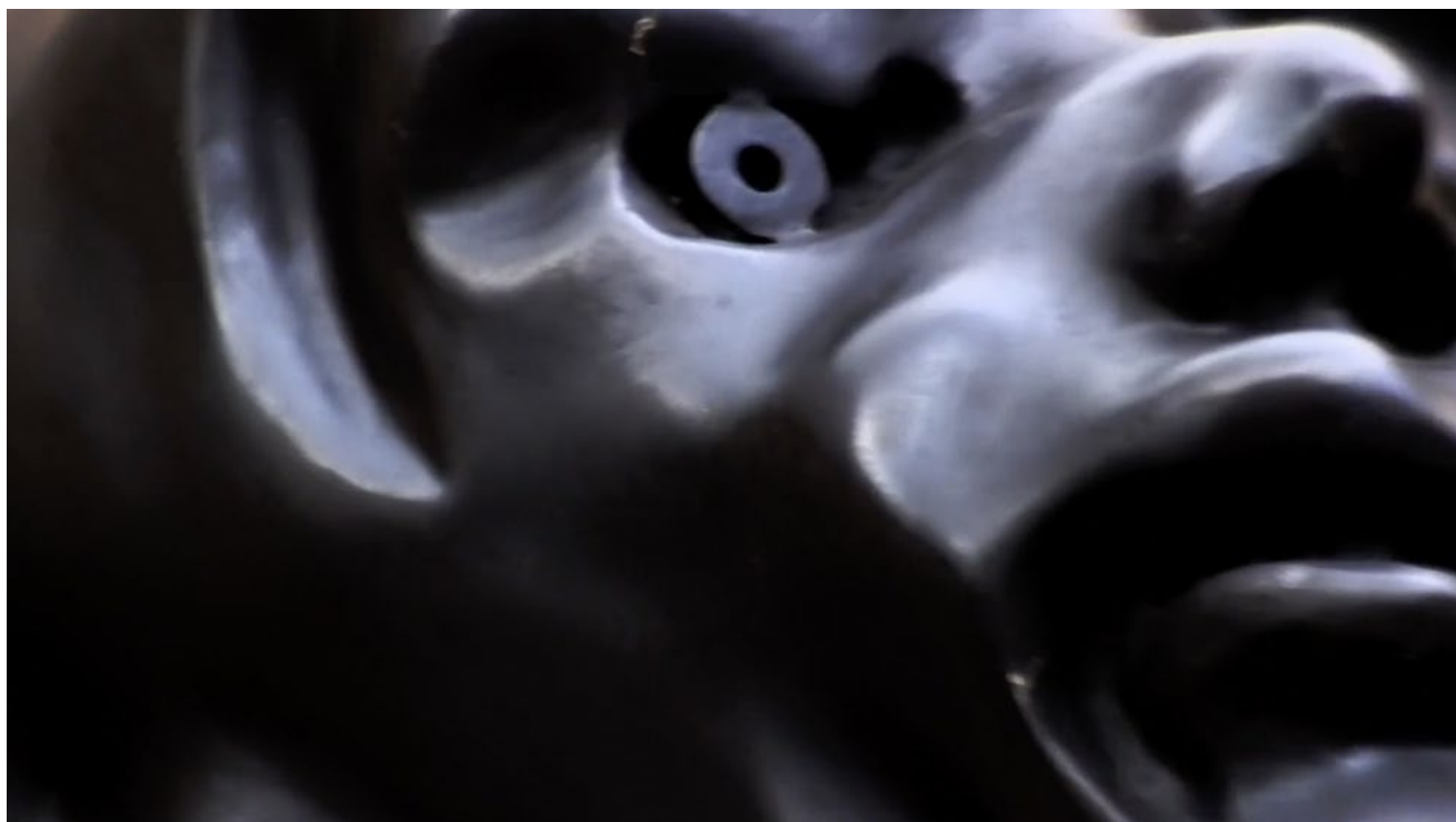
Patrik Pion, Les choses s'effacent devant leurs représentations , 2019

Atomic Cinéma 23 rue du Prieuré 18700 Aubigny-sur-Nère Centre-Val de Loire