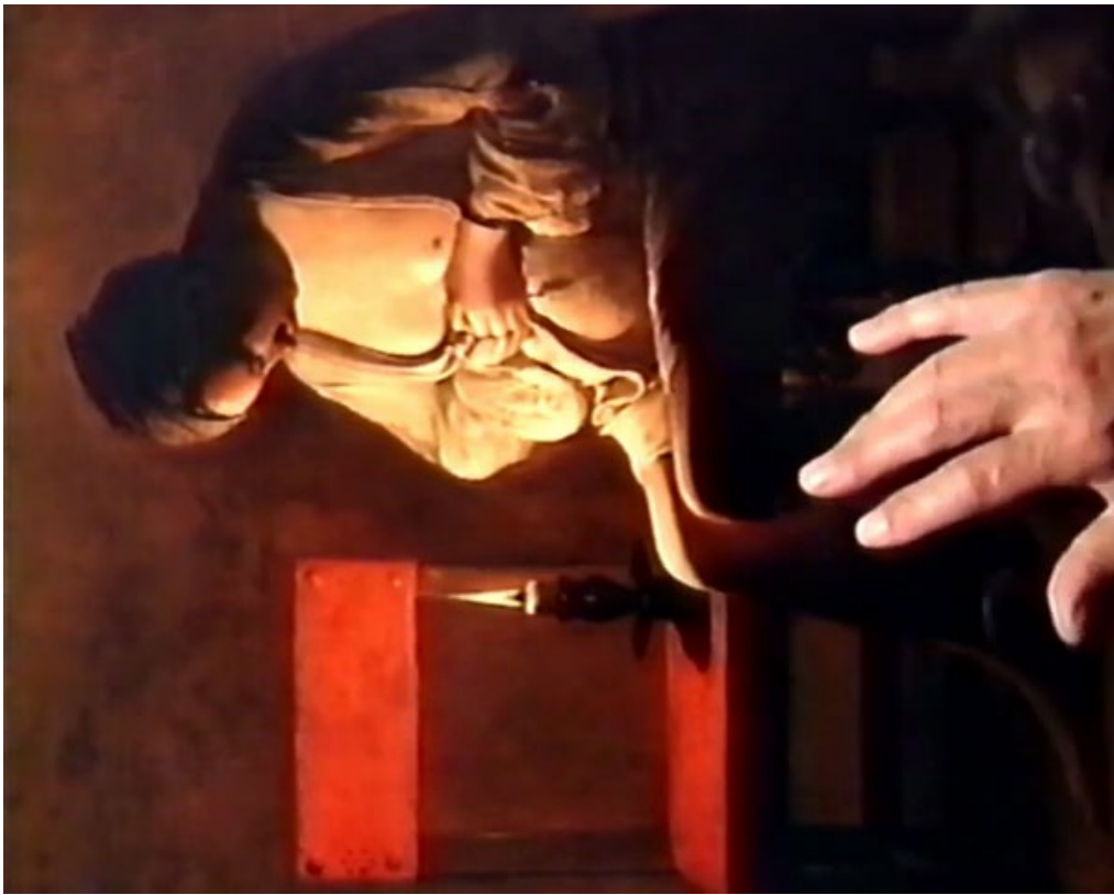
Alain Cavalier, Georges de la Tour , 1997