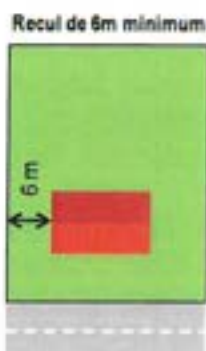
Illustration explicative :