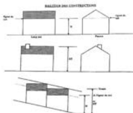
Illustration explicative :