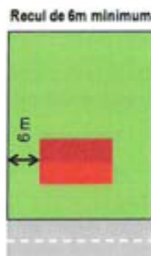
Illustration explicative :